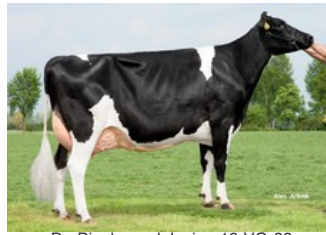
De Biesheuvel Javina 19 VG-88