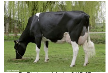
De Biesheuvel Javina 3 VG-87