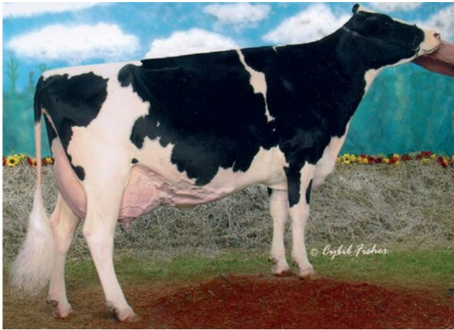
MS Kingstead Chief Adeen EX-94