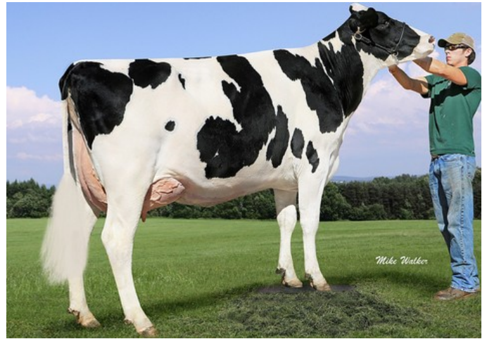
Farnear-TBR-BH Valour VG-88

VG-86 Racer x VG-88 Supersire x VG-87 Shottle x EX-91 Goldwyn x EX-92 Outside x EX-94 Skychief x EX-94 Starbuck x Sheik