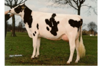
Southland Dellia 2 VG-88

VG-87 Platinum x GP-84 G-Force x VG-87 Goldwyn x GP-84 Shottle x EX-90 Adam x VG-88 Lucky Leo x VG-86 Largo x VG-88 Jabot x VG-87 Southwind x VG-85 Chairman