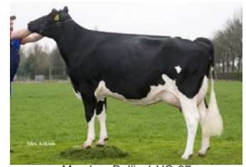
Manders Dellia 1 VG-87