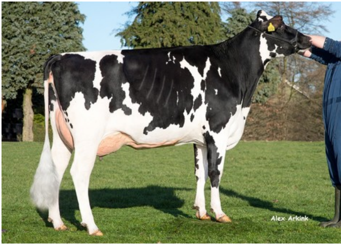
K&L PL Dellia 6538 VG-87