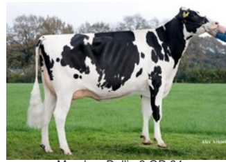
Manders Dellia 8 GP-84