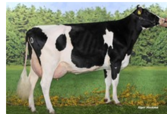
Caps Mairy 1 VG-85

Precision x Gladius x VG-87 Gymnast x Shep x VG-86 Balisto x VG-88 Sudan x VG-87 Xacobeo x VG-85 Goldwyn x VG-85 O Man x VG-87 Durham