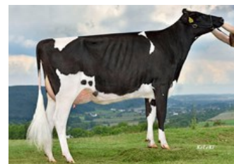
Vekis Sudan Mellow VG-88