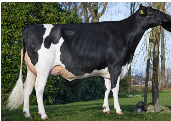
Veelhorst Melody VG-87