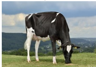
Vekis Sudan Mellow VG-88