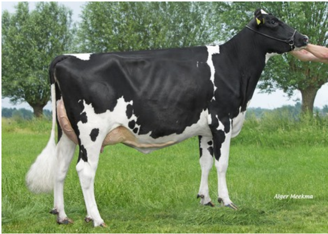
Wilder Kalibra RDC VG-88