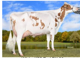
Wilder K25 Red EX-90