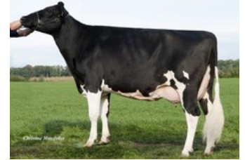
Wilder Kairo 55 RDC VG-89

Sega P RDC x Sailor PP x GP-83 Gywer RDC x GP-82 Styx Red x VG-88 Battlecry x EX-90 Brekem RDC x VG-88 Snowman x VG-89 Shottle x VG-88 Ramos x GP-84 Danube-Red