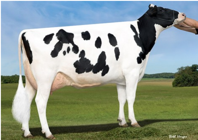
Sandy-Valley NU Precious VG-88