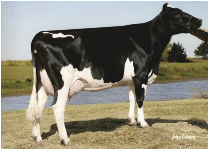
De-Su Oman 6125 GP-82