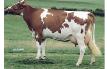
Apina Massia 14 VG-85

Warren P RF x VG-85 Martin x GP-84 Yoda x VG-85 Mission P RDC x VG-88 Apoll P Red x VG-85 Brekem RDC x VG-89 Snowman x EX-90 Shottle x EX-90 Lentini x VG-85 Tulip