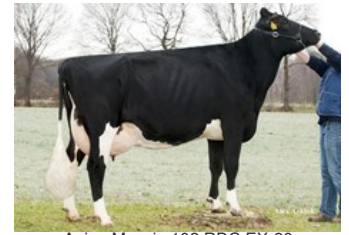
Apina Massia 102 RDC EX-90