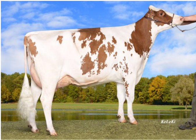
Wilder Saturn P Red VG-88