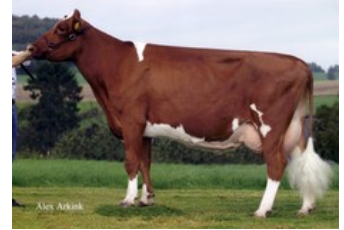
Apina Massia 21 EX-90

Warren P RF x VG-85 Martin x GP-84 Yoda x VG-85 Mission P RDC x VG-88 Apoll P Red x VG-85 Brekem RDC x VG-89 Snowman x EX-90 Shottle x EX-90 Lentini x VG-85 Tulip