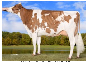
Wilder Smile Red VG-85