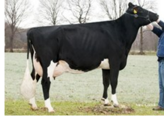
Apina Massia 102 RDC EX-90