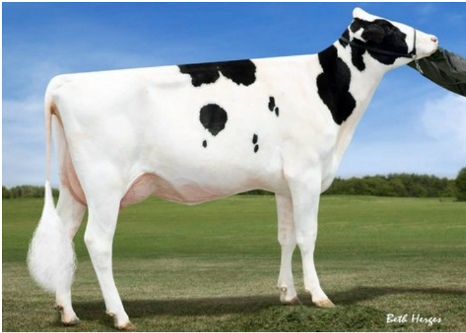
Butlerview Colt Pixie VG-87