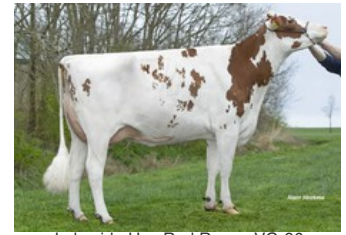
Lakeside Ups Red Range VG-86