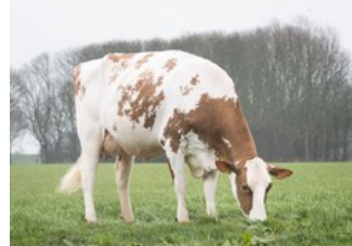
Koepon OH Rubels Range 17 Red VG-86