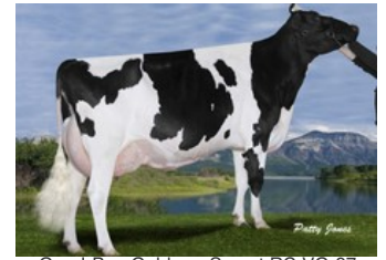
Gen-I-Beq Goldwyn Secret RC VG-87