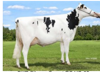
DKR Silence Secret RC VG-85