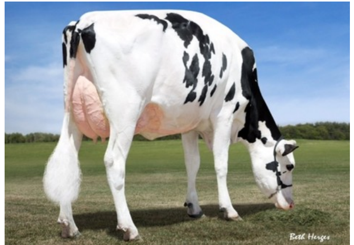
Dymentholm Sunview Sunday VG-87

Gameday x Rubels-Red x GP-84 Salvatore Rc x Rubicon x GP-83 Cashcoin x VG-87 Snowman x EX-90 Planet x VG-85 Bolton x VG-87 Goldwyn x VG-87 Durham Roodfactor Gameday met een knap gTPI profiel!