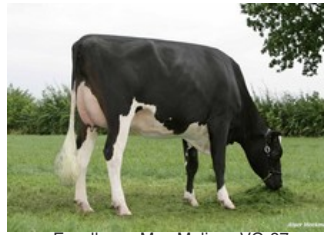
Excellence Mac Melissa VG-87