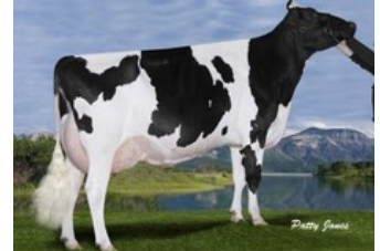
Gen-I-Beq Goldwyn Secret RC VG-87

Rubels-Red x GP-84 Salvatore Rc x Rubicon x GP-83 Cashcoin x VG-87 Snowman x EX-90 Planet x VG-85 Bolton x VG-87 Goldwyn x VG-87 Durham x VG-86 Formation