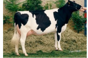
Grietje 80 EX-91

GP-83 Summerlake x GP-81 Adorable x GP-84 Cinema x VG-86 Shotglass x VG-85 Beacon x VG-88 Juwel x VG-86 O Man x VG-87 Aaron x EX-91 Esquimau x VG-89 Lucky Leo