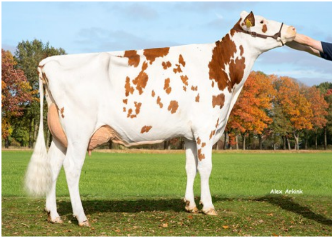
De Oosterhof K&L Kalibra 1 P Red