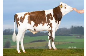
3STAR OH Ragnar Red

Solitaire P Red x VG-87 Styx Red x VG-88 Battlecry x EX-90 Brekem RDC x VG-88 Snowman x VG-89 Shottle x VG-88 Ramos x GP-84 Danube-Red