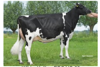
Wilder Kalibra RDC VG-88