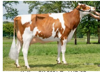
Kalibra SX 5631 Red VG-87