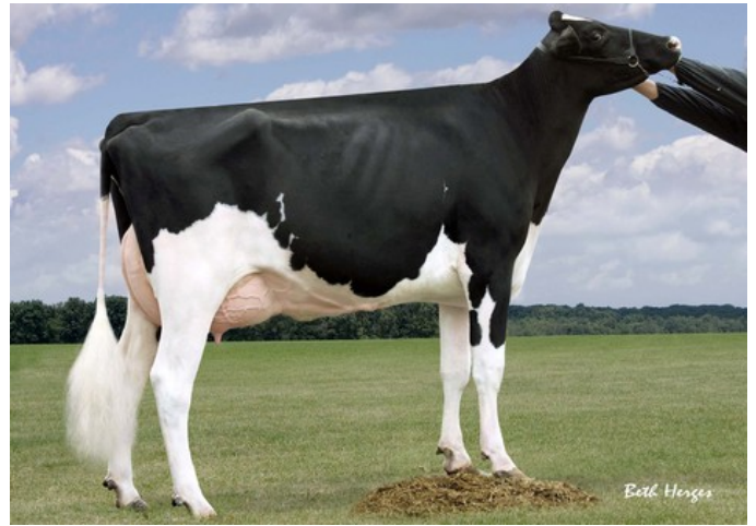
Nova-TMJ Golden Erin-ET EX-90

VG-85 Yoda x VG-87 Silver x VG-88 Shotglass x EX-90 Altalota x EX-90 Goldwyn x VG-87 Roy x EX-90 Mark Sam x EX-90 Patron x VG-87 Southwind x VG-85 Jax