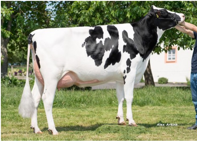
HES Emi (v. Silver) VG-87