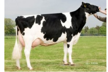
Holbra Pam VG-87

VG-87 Cameron x VG-88 Board x VG-88 Balisto x VG-87 Man-O-Man x VG-87 Mascol x VG-88 Durham x EX-90 Rudolph x EX-95 Chief Mark x EX-91 Sexation x EX-93 Elevation