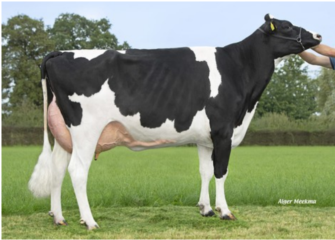
Holbra Malon 17 VG-87