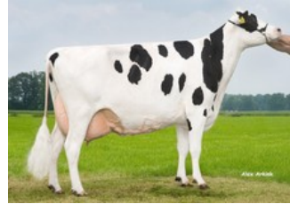
Holbra Malon VG-87