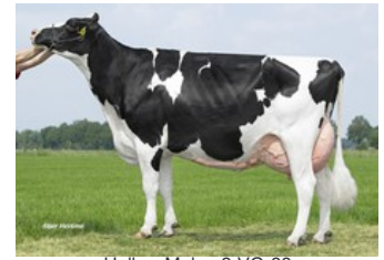
Holbra Malon 3 VG-88