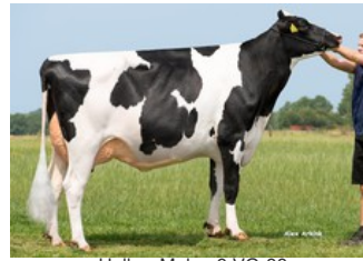
Holbra Malon 9 VG-88