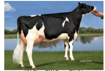
KY-Blue GW Dana EX-91