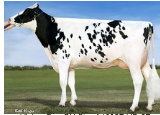
Vision-Gen SH Sho A12037 VG-87