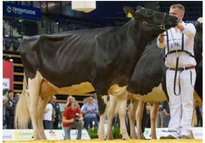
NH HS Marilyn Monroe VG-86

VG-86 Solo x VG-86 Balisto x VG-88 Sudan x VG-87 Xacobeo x VG-85 Goldwyn x VG-85 O Man x VG-87 Durham x GP-83 Fred x VG-86 Mascot x VG-87 Cleitus