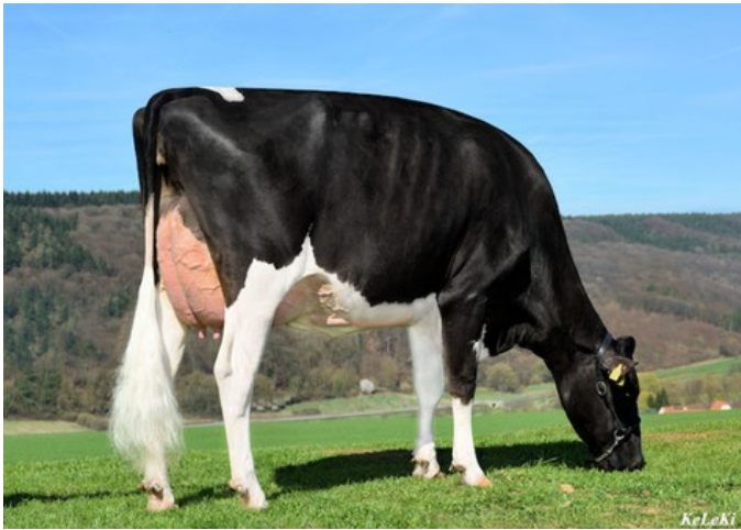
NH HS Marilyn Monroe VG-86