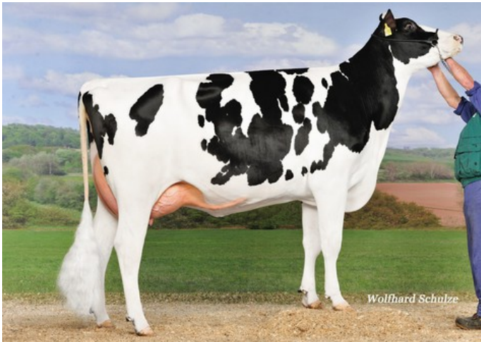
RR Elisa Marie VG-86