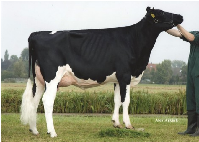
VanHolland Rochelle VG-88