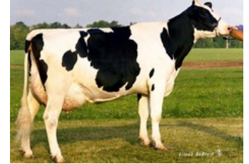
Tui Onyx Nick VG-86

VG-87 Fanatic x VG-88 Atwood x VG-87 Ramos x VG-86 BW Marshall x VG-85 Lord Lily x VG-86 United Nick x VG-89 Ned Boy x VG-86 Bell