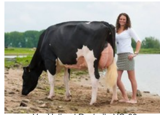
VanHolland Rochelle VG-88