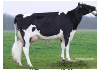
WEH Janne VG-86