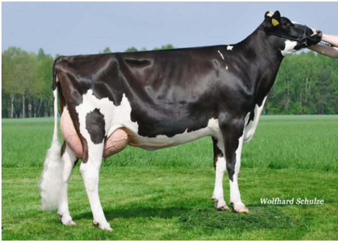
WEH Bronco Jill, Bronco x Janne VG-86