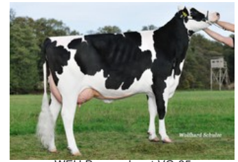
WEH Bronco Janet VG-85