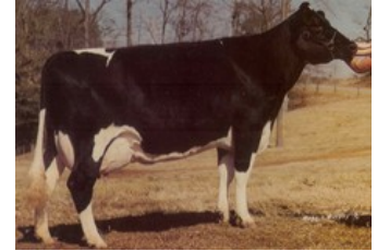
Rilara Mars Las Ravena EX-91

GP-80 King Royal x VG-86 Silver x VG-86 Supersire x VG-85 Bronco x VG-86 Jefferson x VG-88 Laudan x VG-87 Convincer x EX-90 Airliner x GP-84 Mountain x VG-86 Melwood