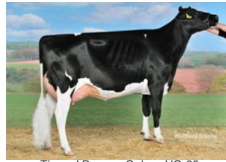
Tirs vad Beacon Galaxy VG-85