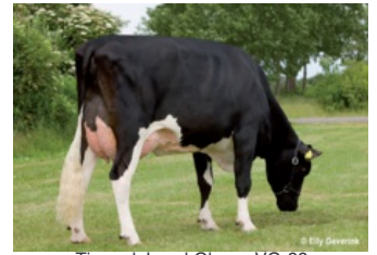
Tirs vad Juwel Ghana VG-88