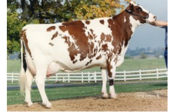
Stookey Fagn Scarlet-Red EX-94

GP-83 Euclid x Balisto x VG-86 Lawn Boy P-Red x VG-87 Shottle x VG-87 Marmax x VG-86 Patron x VG-87 Aerostar x VG-89 Enhancer x EX-94 Fagin x EX-95 Crystan