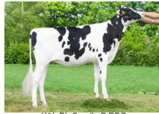
K&L BL Candle P RDC