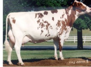
S-F-L Enhancer Scarlett-Red VG-89