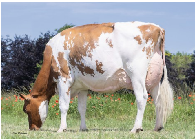
JK Eder Rocca Roxinne 1 Red

JK EDER ROCCA ROXINNE NL 574698766 GEB. 27-03-2023