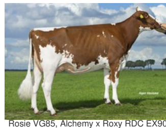
Rosie VG85, Alchemy x Roxy RDC EX90