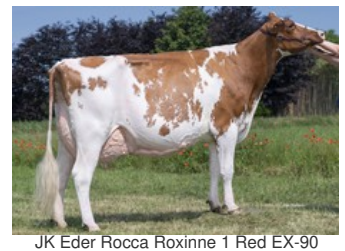
JK Eder Rocca Roxinne 1 Red EX-90