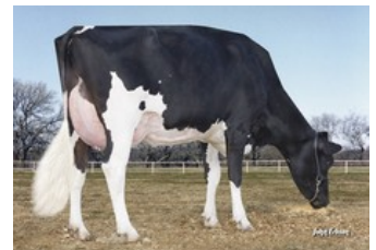
Morningview Pronto C-Rae EX-90

Amaretto-Red x EX-90 Apoll P Red x GP-84 Brekem RDC x Alchemy RDC x EX-90 Superstition x EX-90 Pronto x EX-93 Goldwyn x EX-90 Rubens RF x EX-90 Jubilant RF x EX-96 Tony