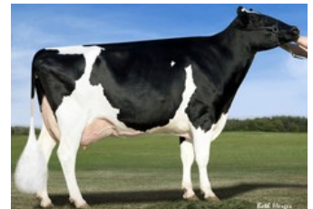
KHW Goldwyn Aiko RDC EX-91