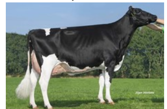
A-L-H Australia RDC VG-87

VG-86 Solitair P Red x Alaska Red x VG-85 Salsa RC x VG-87 Supersire x VG-85 Alexander x EX-91 Goldwyn x EX-95 Durham x EX-93 Prelude x EX-94 Jubilant RF x EX-96 Marquis King