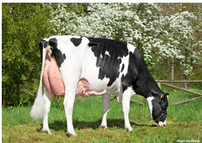
KHE I'm Good