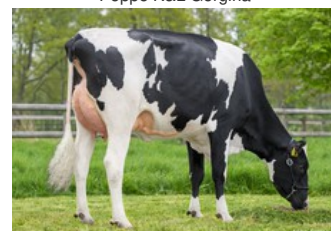
K&L Poppe Goody VG-86

VG-88 Gymnast x VG-87 Rubicon x VG-89 Shotglass x VG-88 Windbrook x VG-88 Jeeves x VG-85 Goldwyn x VG-85 Juror Ford x VG-85 Cleo x VG-89 Aerostar x EX-92 Ugela Bell