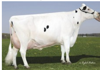
Gold-N-Oaks Morty Malibu EX-94