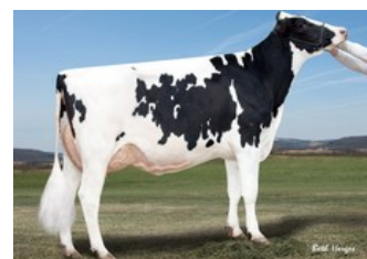
Gold-N-Oaks Arabell 1765 VG-88, Ramos