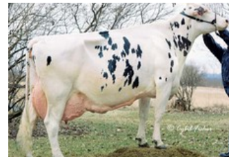
Gold-N-Oaks Duster Cindy VG-88

Tricky Red x Freestyle-Red x GP-84 Riveting x EX-91 Superhero x Silver x GP-82 Supersire x VG-87 Bookem x VG-88 Man-O-Man x VG-89 Shottle x EX-94 Morty