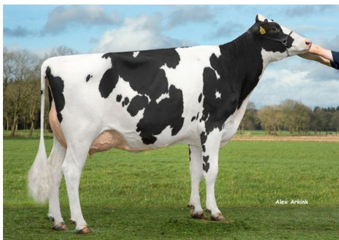
Tirs vad K&L Riveting Magnolia GP-84