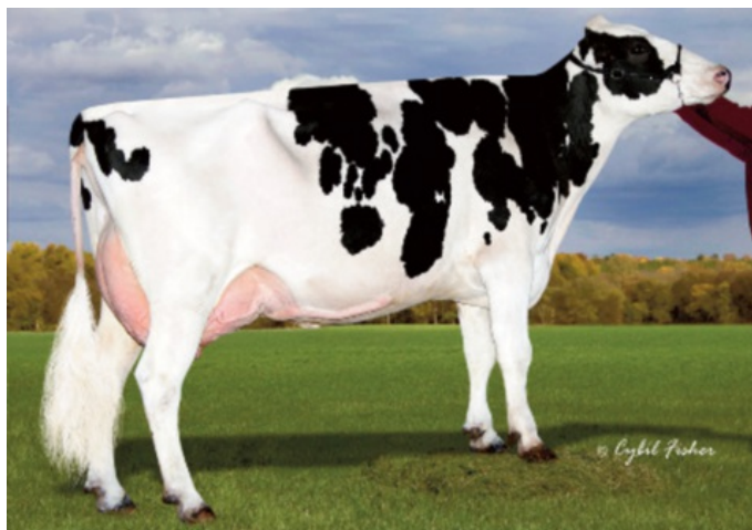
Pen-Col Bookem Mia family member