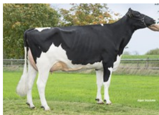
Poppe K&L Gorgina