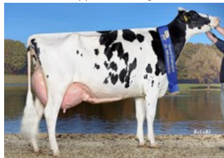
KHE Iowa EX-92, full sister to KHE Island