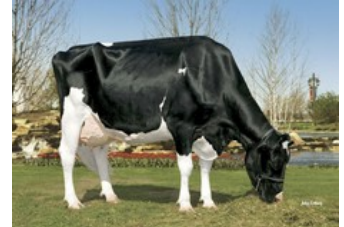
Kamps-Hollow Durham Altitude EX-95

Rammstein Red x Freestyle-Red x VG-85 Swingman Red x Alaska Red x VG-85 Salsa RC x VG-87 Supersire x VG-85 Alexander x EX-91 Goldwyn x EX-95 Durham x EX-93 Prelude