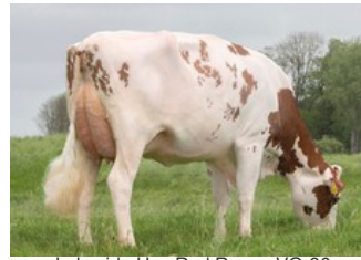
Lakeside Ups Red Range VG-86