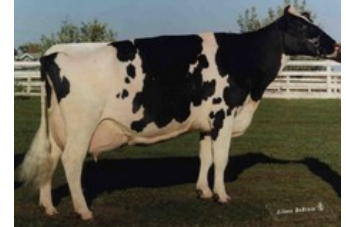
Golden-Oaks Mark Prudence EX-95

Skyliner-Red x Sputnik RDC x VG-85 Swingman Red x VG-86 Salvatore Rc x VG-89 Rubicon x GP-83 Aikman RDC x VG-85 Man-O-Man x VG-87 Mascol x VG-88 Durham x EX-90 Rudolph