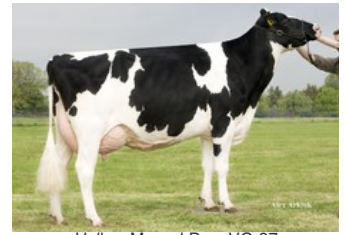
Holbra Mascol Pam VG-87