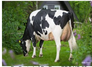
De Oosterhof Dg Rose RDC VG-89