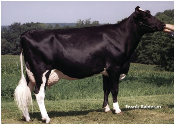
Tolare Rudolph Cupid, zus v Jimtown QP VG-85