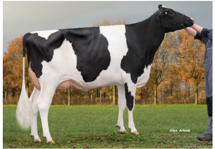
K&L OH Mabel

Revolution x VG-85 AltaZazzle x Kenobi x Granite x VG-85 Rubicon x GP-84 Cashcoin x VG-86 Man-O-Man x VG-86 Shottle x GP-84 Finley x Brett