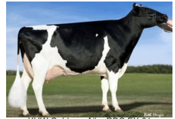
KHW Goldwyn Aiko RDC EX-91