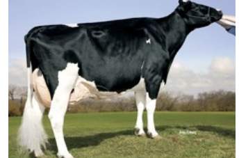
Kamps-Hollow Durham Altitude EX-95

Ranger-Red x VG-86 Solitair P Red x Alaska Red x VG-85 Salsa RC x VG-87 Supersire x VG-85 Alexander x EX-91 Goldwyn x EX-95 Durham x EX-93 Prelude x EX-94 Jubilant RF