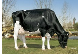
Kamps-Hollow Durham Altitude EX-95