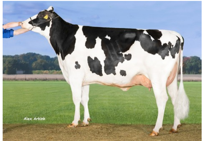
Koepon Oak Classy 4672 GP-83

VG-85 Imax x Silver x GP-83 AltaOak x VG-85 Man-O-Man x VG-85 Shottle x VG-86 Simon x VG-86 Merrill x VG-88 Bell Elton x VG-87 Rotate x VG-88 Wayne