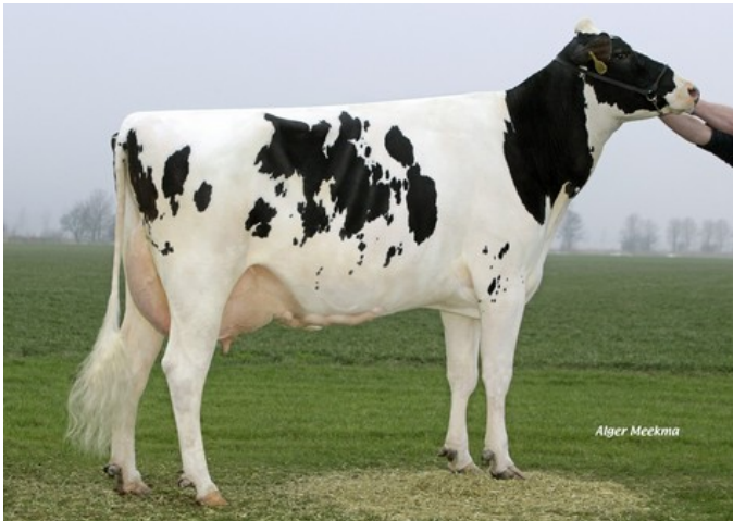
Koepon Shot Classy 17 VG-85