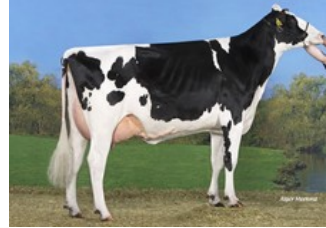
Koepon Mano Classy 90 VG-85