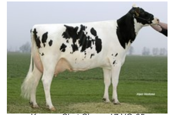
Koepon Shot Classy 17 VG-85