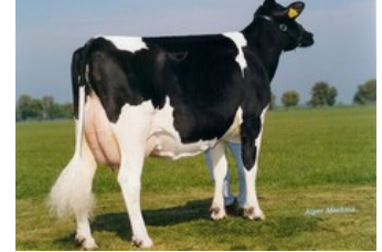
Koepon Classy VG-86

VG-87 Superhero x Silver x GP-83 AltaOak x VG-85 Man-O-Man x VG-85 Shottle x VG-86 Simon x VG-86 Merrill x VG-88 Bell Elton x VG-87 Rotate x VG-88 Wayne